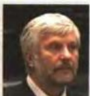
Πέτρος Τσατούλης Περιφερειαρχής Πελοποννήσου