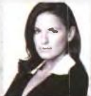
Όλγα Κεφαλογιάννη Νέα Δημοκρατία