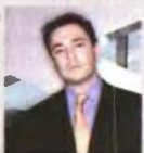
Ούσοúσα Αθανάσου Lamda development