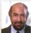
Γιώργος Νικητιάδης Υφυπουργός Πολιτισμού & Τουρισμού