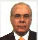
Γεώργιος Παπαϊωάννου Piraeus Real Estate