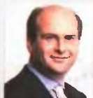
Κωστής Χατζηγεωργιάκης Νέα Δημοκρατία