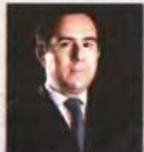
Νότης Μπακράκης Νέα Δημοκρατία