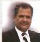
Παναγιώτης Οικονομού Αναπληρωτής Υπουργός Οικονομικών