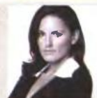
Όλγα Κεφαλογιάννη Νέο Δημοκρατία