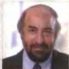
Γιώργος Νικητιάδης Υφυπουργός Πολιτισμού & Τουρισμού