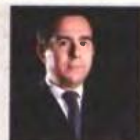
Νότης Μπαράκης Νέο Δημοκρατία