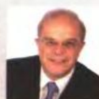
Καθ. Χάρης Κοκκώσης Πανεπιστήμιο Θεσσαλίας