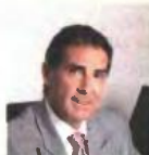
Γιργόρης Δούκας Εταιρεία Ακινήτων Δημοσίου