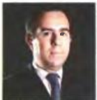
Νότης Μιτρακάκης Υφυπουργός Ανάπτυξης