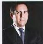
Νότης Μπαράκης Νέα Δημοκρατία