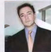
Οδυσσεύς Αθανασίου Lamda development