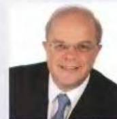
Καθηγ. Χάρης Κοκκώσης Πανεπιστήμιο Θεσσαλίας