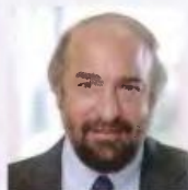
Γιώργος Νικητιάδης Υφυπουργός Πολιτισμού & Τουρισμού